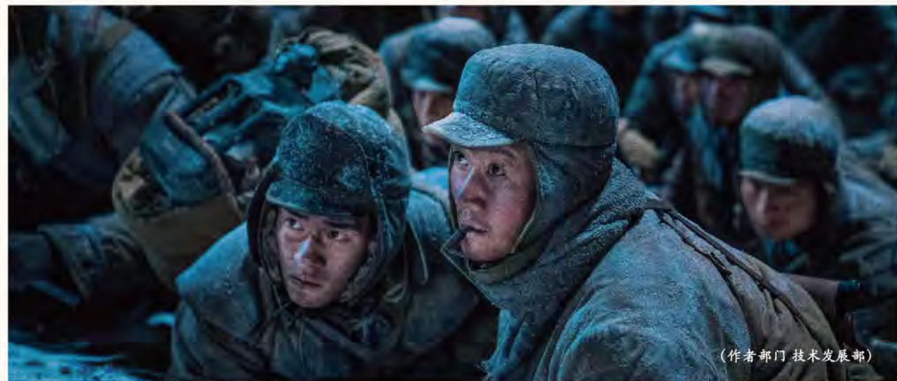
(作者部门 技术发展部)

对于一个企业来说，在其发展的道路上总会有些途径行不通。但是，我们可以换一种思维，换一种方式而为之，打破陈规旧律，不走寻常路，寻找更好的办法，这便是创新。