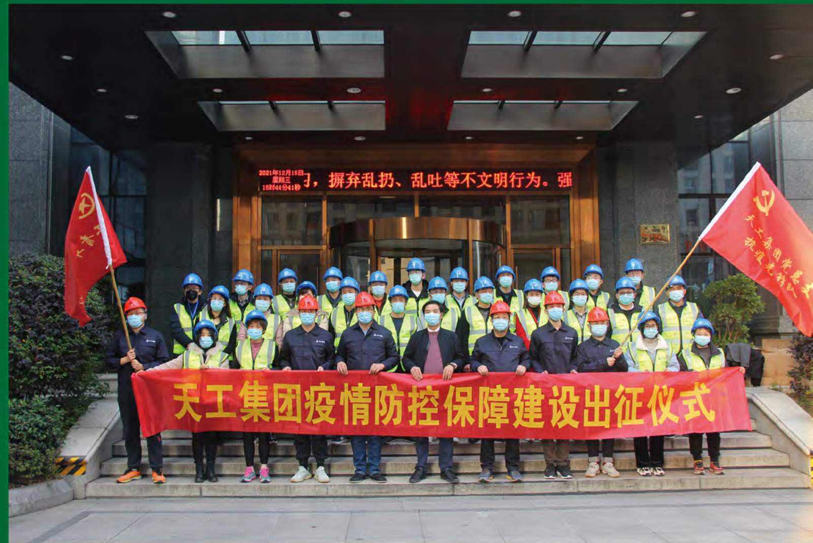
天工集团疫情防控保障建设出征仪式现场

地址: 绍兴市柯桥区柯桥街道华宇路150号天工大厦23楼 电话: 0575-85654518 传真: 0575-85654518 电子邮箱: zhejiangtg@163.com 网址: www.zjtgroup.com